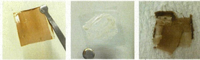
図 1. 融解時に Fe(TPP)Cl を加えた後急冷することで得た (左) ZnPIm、(中) ZnPBta、(右) ZnPClbim ガラス膜の写真

を掻き取ったのち、室温まで急冷することでガラス膜を得た (図1)。 ZnPIm を用いた場合には、凹凸や割れがなく、一様に Fe(TPP)Cl 由来の赤色に着色した透明ガラス膜が得られた。一方、 ZnPBta を用いた場合 Fe(TPP)Cl 粉末がガラス内に残っていた。また ZnPClbim を用いた場合は、Fe(TPP)Cl は均一に分散したものの、均一な厚さを有する透明膜にならなかった。これ以降、 ZnPIm を主に実験に用いた。Fe(TPP)Cl を含む ZnPIm ガラス膜を以下 Fe/g-ZnPIm と示す。